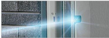
LICHTSCHRANKE FÜR GARAGENTORE