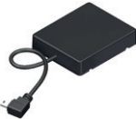
NOVOFERM HOMEMATIC IP MODUL